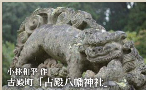
小林和平方作 古殿町「古殿八幡神社」