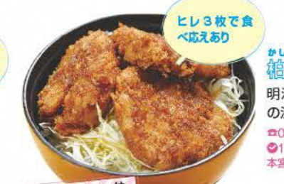
ヒレ3枚で食べ応えあり

だいこくや 看板メニューは一度に15種類の食材がとれる、だいこくやラーメン。体が喜ぶ一品だ。 ☎0243-44-3178 ⑧10:30~15:00 ⑨水曜 ⑩本宮市白岩柳内61-1 ⑪あり [MAP] J-5