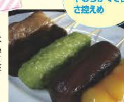
やわらかくて甘さ控えめ

昔ながらの手作りだんごは自家製G無添加で安心・安全。店内でおでんなども食べられる。 ☎0243-33-6300 ⑧9:00~18:00 ⑨不定休 ⑩本宮市本宮南町26 ⑪あり [MAP] C-3