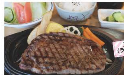
ステーキ定食(ランチ) 1944円

遠方からファンが訪れる人気店から、地元密着型の隠れた名店まで、本宮の美味しいものが大集合。お気に入りを見つけてね♪