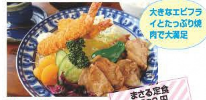
大きなエビフライとたっぷり焼肉で大満足

かなざわ 大きな窓が開放的な駅前レストラン。おすすめはジューシーな肉が絶品のステーキ定食。 ☎0243-33-1199 ⑧11:30~14:30、17:00~22:00(金土曜~23:00) ⑨日曜 ⑩本宮市本宮丸縄21 ⑪あり [MAP] C-3