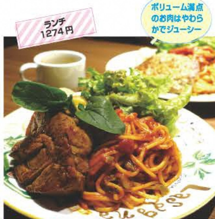
ボリューム満点のお肉はやわらかでジューシー

寿司・割烹 江戸常 創業70年の老舗寿司店。ランチのほかに鮎ステーキ880円などの一品料理も人気。 ☎0243-33-2343 ⑧11:30~23:30 ⑨火曜 ⑩本宮市本宮南町26-7 ⑪あり [MAP] C-3