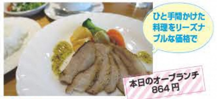
ひと手間かけた料理をリーズナブルな価格で

トラットリア アズーロはるかぜ 大人が集うシックなイタリアンビストロ。落ち着いた雰囲気です。ランチタイムが過ごせる。 ☎0243-37-2604 ⑧11:00~13:30、17:30~21:30 ⑨日曜、祝日、第3-5月曜 ⑩本宮市本宮南町156-1 ⑪なし [MAP] C-2