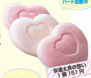
安達太良の想い 1個 151円

明治から続く和菓子店で、ルベールの名で洋菓子部門も展開。地元素材を使ったもみやまじゅうも。 ☎0243-34-2203 ⑧8:00~19:00 ⑨月曜(祝日の場合翌日休) ⑩本宮市本宮馬場98 ⑪あり [MAP] C-1