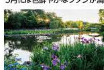
約30万本といわれる花菖蒲は6月が見ごろ