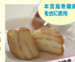
本宮烏骨鶏卵を衣に使用

もちもち食感が人気のチーズを使った焼き菓子などが揃う。店の奥にはカフェを併設している。 ☎0243-34-2341 ⑧8:30~19:30 ⑨水曜 ⑩本宮市本宮下町45-1 ⑪あり [MAP] C-2