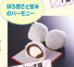
ほろ苦さと甘みのハーモニー