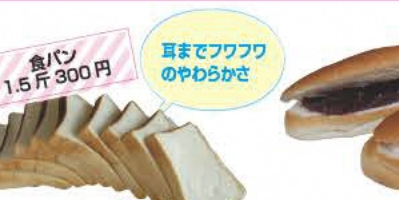
食パン 1.5斤 300円