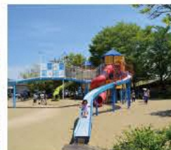
新しい大型遊具はキッズたちのお気に入り

☎0243-24-5405(本宮市まちづくり推進課) ●入園自由 ●本宮市本宮馬場27-10 ●あり [MAP] C-1