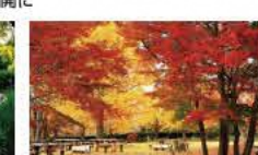
秋は美しい紅葉の中で散策を楽しみたい