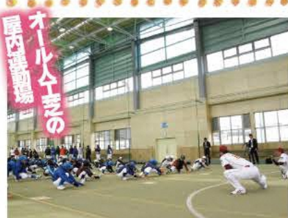
落成式の日に行われた野球教室の様子