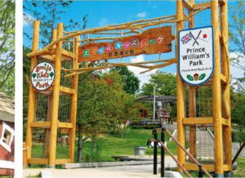
英国のウィリアム王子の訪問を記念し愛称が付いた

約8000㎡の園内に地形を生かした大型の木製遊具などが多数点在。充実した設備の屋内あそび場とあわせて無料で楽しめる。