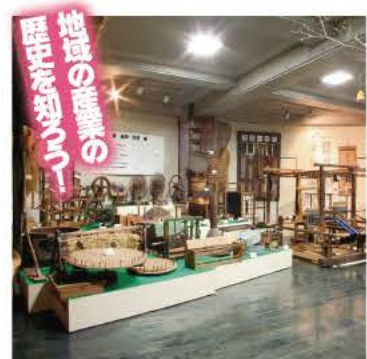
国登録有形民俗文化財の養蚕関係道具類