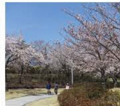
桜の時期にはお花見スポットとしても人気