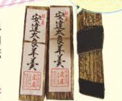
安達太良羊羹 1本 630円

地元・南達地域で栽培された小豆を使った和菓子が自慢。お茶うけにぴったりな伝統の味。 ☎0243-33-2420 ⑧8:30~19:00 ⑨月曜 ⑩本宮市本宮万世25-2 ⑪なし [MAP] B-2