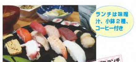
ランチは味噌汁、小鉢2種、コーヒー付き

aube/レストラン レジエブルー パンケットホールの1Fにあるレストラン。オシャレな空間で友人とのランチや家族でのディナーに。 ☎0243-24-8140 ⑧11:30~14:30、17:30~21:00 ⑨日曜 ⑩本宮市本宮南町38 ⑪あり [MAP] C-2