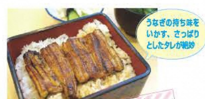
うなぎの持ち味をいかに、さっぱりとしたタレが絶妙

味の家まさる 白沢にある、お手頃価格が自慢の食堂。名物・まさる定食はボリューム満点でドリンクがサービス。 ☎0243-44-3999 ⑧11:00~15:00、17:00~21:00 ⑨木曜 ⑩本宮市糠沢石神111-4 ⑪あり [MAP] I-5