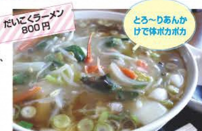
たいにくラーメン 800円

かねまる 金丸本店 大正時代創業の鳥料理専門店。おすすめは鳥の旨みたっぷりのスープを使った中華そば。 ☎0243-34-2014 ⑧11:00~14:00、17:00~20:00(スープがなくなり次第閉店) ⑨月曜 ⑩本宮市本宮中條68-1 ⑪あり [MAP] C-3