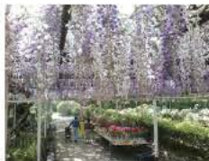
5月の見ごろの時期には、ふじ祭りを開催