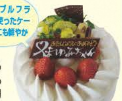
パースデーケーキ5号(高約15cm) 2484円

厳選した生クリームが決め手のパースデーケーキはもちろん、半熟プリン270円も美味。 ☎0243-33-2277 ⑧9:00~20:00 ⑨不定休 ⑩本宮市本宮上町3-1 ⑪あり [MAP] C-4