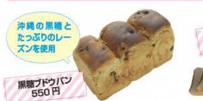
沖縄の黒糖とたっぷりのレーズンを使用

ひみしよくどう 一二三食堂 麺類や定食など約50種類のメニューが揃う。なかでも本宮烏骨鶏を使った料理は必食だ。 ☎0243-33-2373 ⑧11:00~20:00 ⑨火曜(祝日の場合は営業) ⑩本宮市本宮上町35-3 ⑪あり [MAP] C-4