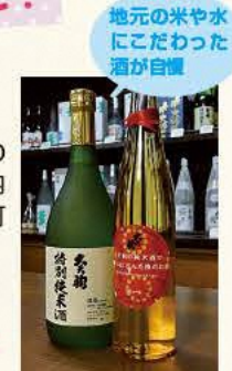
地元の米や水にこだわった酒が自慢

☎0243-33-2017 ●9:00～17:00 ●日曜、祝日 ●本宮市本宮宇九輪18 ●なし [MAP] C-3