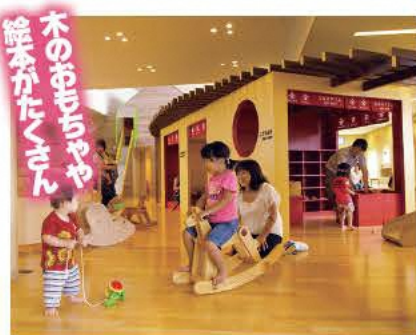
未就学児と保護者が遊べる子育てサロン

☎0243-34-2036 ●9:00～16:30(4月1日～10月25日)、9:00～17:00(10月26日～11月30日) ●12月1日～3月31日 ●大人700円、小人400円 ●本宮市本宮蛇ノ鼻38 ●あり [MAP] E-4