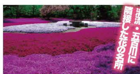
5月には色鮮やかなツツジが満開に