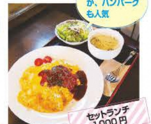
オムライスのほか、ハンバーグも人気