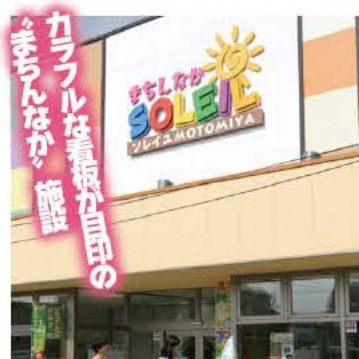
カフェや休憩スペースで、のんびりできる

☎0243-63-2780 ●9:00～18:00 ●火曜(祝日の場合翌日休)、年末年始 ●本宮市千代田60-1 ●あり [MAP] A-2 施設内にはカフェや調理実習室などもある