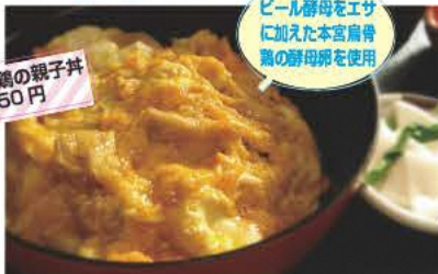
本宮烏骨鶏の親子丼 1050円

かしわやしよくどう 植屋食堂 明治時代創業の大衆食堂。ソースかつ丼の味の決め手は、甘みを効かせた秘伝のソース。 ☎0243-34-2129 ⑧11:00~15:30、16:30~20:00 ⑨火曜 ⑩本宮市本宮仲町33 ⑪あり [MAP] D-1