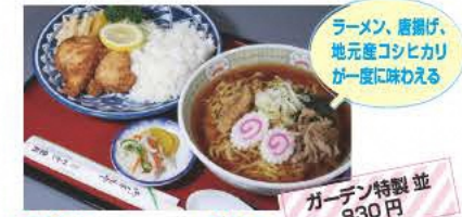
ラーメン、唐揚げ、地元産コシヒカリが一度に味わえる

カフェ& レストラン Café 蔵 大正時代の蔵をリノベートしたカフェ&レストラン。天井の梁や漆喰の壁が見事。 ☎0243-34-4456 ⑧11:00~17:30、19:00~24:00 ⑨水曜、祝日 ⑩本宮市本宮中條1-2 ⑪あり [MAP] C-3