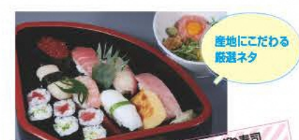
産地にこだわる厳選ネタ

味処 ガーデン 金丸 鳥と香味野菜のみで仕上げたラーメンスープはあっさりヘルシー。中太麺との相性も◎。 ☎0243-33-4281 ⑧11:00~14:00、17:00~20:00 ⑨火曜 ⑩本宮市本宮字万世145-3 ⑪あり [MAP] B-2